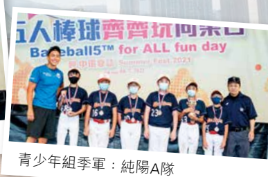
青少年組季軍：純陽A隊