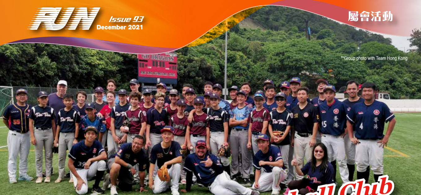
**Group photo with Team Hong Kong