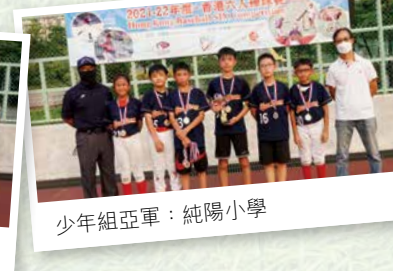
少年組亞軍：純陽小學