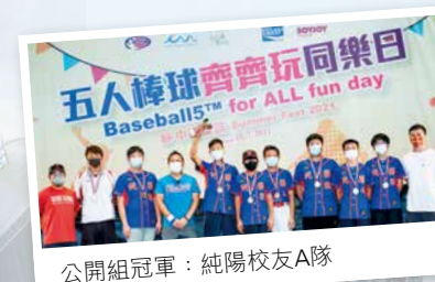
公開組冠軍：純陽校友A隊

最後再次恭喜今年「純陽校友 A 隊」與「純陽 B 隊」以全勝姿態成功包攬兩組賽事的冠軍寶座！與此同時，感謝參與本次活動的所有隊伍以及支持我們的觀眾，我們將會舉辦更多其他的 Baseball5™ 活動，大家繼續關注我們喔！