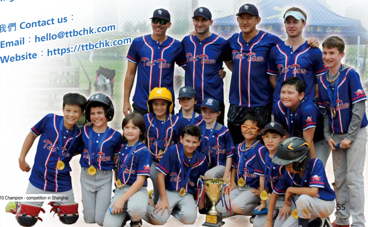
**U10 Champion - competition in Shanghai