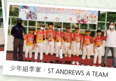
少年組季軍：ST ANDREWS A TEAM