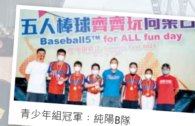
青少年組冠軍：純陽B隊