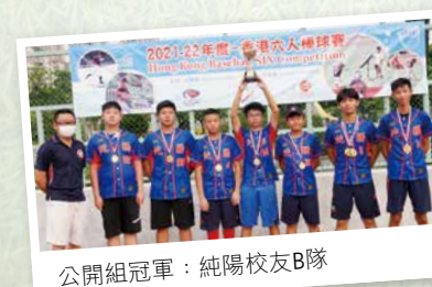
公開組冠軍：純陽校友B隊