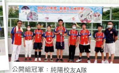
公開組冠軍：純陽校友A隊