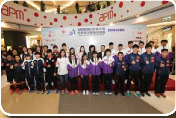
21. 3. 2017 Grand Hall, Hong Kong Convention & Exhibition Centre