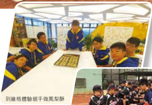
到維格體驗親手做鳳梨酥

香港 U15 青少棒隊由 2016/2017 年度香港男子棒球精英持續培訓計劃 (青棒組) 的註冊精英運動員中選出。上述計劃由香港棒球總會主辦，目的為招募具潛質並有志成為香港棒球代表隊第二梯隊的棒球運動員而參加持續培訓。培訓計劃中除了訓練外，積儲實戰經驗對球員及球隊的技術水平提升極其重要。本會致力聯繫國外不同規模的國際棒球比賽讓球員有實習機會。臺北城市盃青少年棒球錦標賽除台灣球隊外亦有來自日本及韓國的隊伍，正是我們讓青少年棒球員提升技術水平的高階平台，能與亞洲前三名的球隊交戰，相信香港的球員將裨益不少，亦可增進國際體育交流。本會自 2006 年至 2015 年期間選派屬會球隊及學校隊伍參賽。