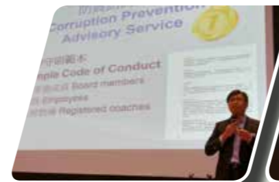
Speaker from Winnie Leung & Co. to share cases in risk management