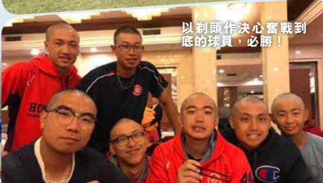
以剃頭作決心奮戰到底的球員，必勝！