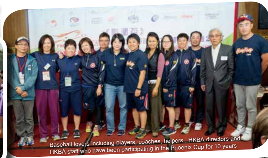
Baseball lovers including players, coaches, helpers, HKBA directors and HKBA staff who have been participating in the Phoenix Cup for 10 years