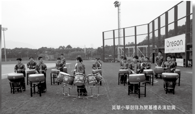
英華小學鼓隊為開幕禮表演助興